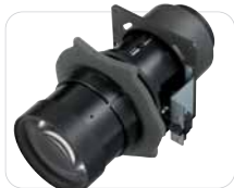
VPLL-Z1024 Zoom-Objektiv (2,38 - 3,26:1)