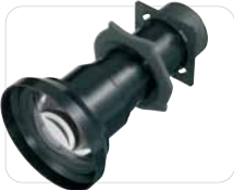
VPLL-1008 *** Festes Objektiv (0,78:1)