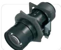
VPLL-Z1032 Zoom-Objektiv (3,24 - 4,95:1)